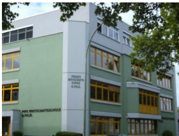
Private Realschule Pelzl